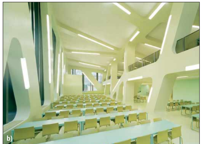
Abb. 3 Äußere (a) und innere (b) Strukturelemente der Mensa Moltke in Karlsruhe